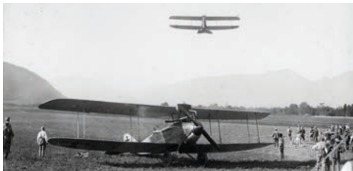
Ena najbolj znanih fotografij letališča Stražišče. Posneta je bila septembra 1917. Letali na fotografiji sta DFW C.V. Na levi se lepo vidi pobočje Šmarjetne gore, v ozadju pa Tolsti vrh in Kriška gora.

Na začasno letališče v Stražišču sta iz zahodne fronte, iz Colmarja v francoski Alzaciji, 23. septembra 1917 prispela 14. letalski od- delek in vod za zračno slikanje št. 1 nemškega vojaškega letalstva. Oddelku je poveljeval konjeniški stotnik Hans Balthazar. Ta je v svoj album s fotografijami vestno dokumentiral pot enote od Colmarja v Franciji do Vidma. Med njimi je tudi kar nekaj foto- grafij iz Stražišča.