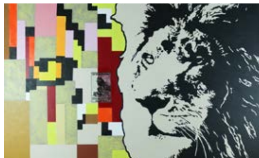
VLADAR ( LEV) / Lev je simbol vladarja, gospodarja. Je mogočen, suveren.

»Slikal sem z akrilnimi barvami in nanesele tudi paus papir z besedilom o britanskem imperiju s sliko leva, ki vlada svetu. Dodal sem tudi gel.«