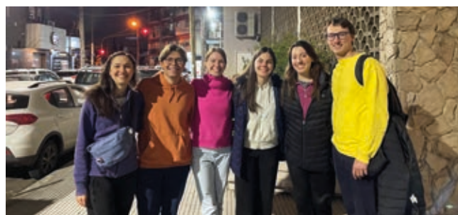
S prijatelji iz Argentine pred Slomškovim domom, Ramos Mejia, Argentina