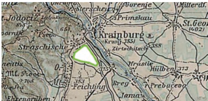
Položaj letališča Stražišče na avstro-ogrskem zemljevidu iz leta 1917

V krajevnem glasilu Sitar je bilo do sedaj objavljenih veliko član- kov o bogati in zanimivi zgodovini Stražišča. Verjetno je danes le še malo takih, ki vedo, da je bilo tu jeseni leta 1917 med prvo svetovno vojno vojaško letališče. Nahajalo se je na terasi nad žele- zniško progo nad Laborami.