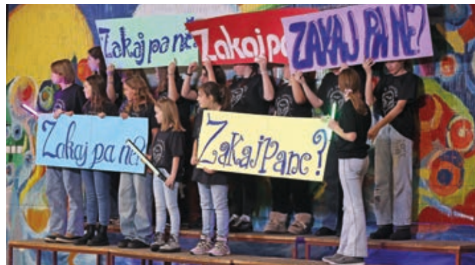
Zakaj pa ne v družbi mladine osnovne šole Stražišče

lesnikom. Za boljši efekt pri snemanju smo imeli tudi LED-lučke, s katerimi smo entuziastično mahali. Ker snemalec nikakor ni bil zadovoljen, smo videospot snemali kar dve uri. Pred začetkom snemanja so novinarji prišli posnet prispevek za 24 ur, kar je bilo zanimivo, saj še nikoli nismo bili na televiziji. Po uspešnem in zanimivem, a precej kratkem snemanju ter številnih ponovitvah smo se utrujeni, a zadovoljni odpravili domov. DIVJA IZKUŠNJA, VAM REČEVA!