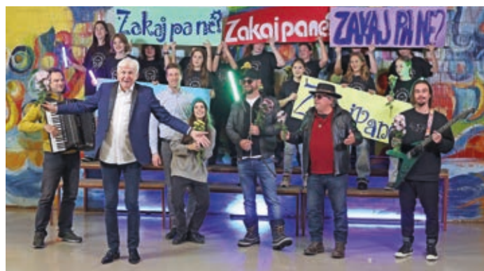
Znani slovenski glasbeniki različnih zvrsti - združeni