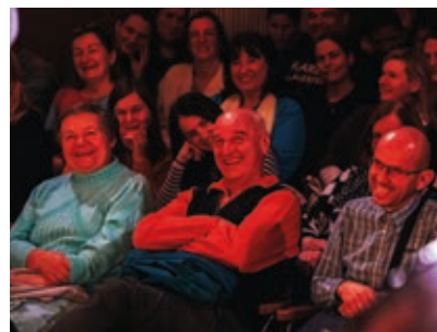
LA LA LAJF »Življenje je žur – dobro se boš imel samo, če ga ne jemlješ prerensno!« In nasmejano občinstvo na fotografiji je najboljši dokaz za to.