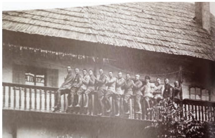
Fotografija oficirjev letalcev nemškega 14. letalskega oddelka na balkonu Šempetrške graščine (grad Šrotenturn) septembra 1917

Ko so nemške letalce in letala ter pomožno osebje z vso potrebno opremo prestavili z Brezovice pri Ljubljani na začasno letališče Stražišče, katerega uradno ime je bilo Kota 383, so že imeli posta- vljene improvizirane šotore za spravilo in vzdrževanje letal. Enota je bila opremljena z izvidniškimi letali DFW C. V., najbolj mno- žično izdelanimi letali v nemškem vojaškem letalstvu. Izdelali so jih več kot 2.000.