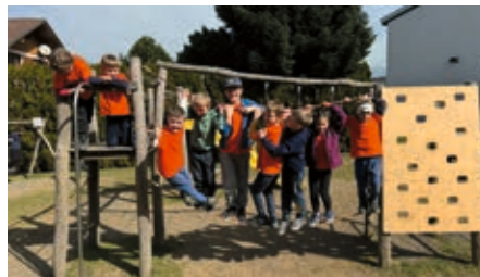
Malo gasilstva, malo akrobatike - pri najmlajših gre to vedno z roko v roki

skače sem in tja kot žoga na gasilskem poligonu, a ko je treba izbrati, kdo se bo peljal v najljubšem gasilskem vozilu, se v hipu spremenijo v prave male stratege. Nenadoma vsi točno vedo, kje morajo stati, koga morajo prehiteti in kako čim prej priti do svojega sanjskega sedeža.