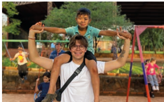
Na potepu prijateljstvo ne pozna meja - otroci povsod vidijo svet z odprtimi srcem