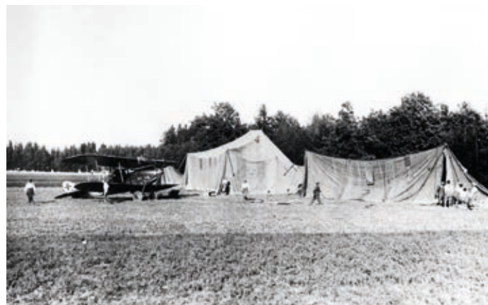
Na letališču Stražišče septembra 1917. Letalo DFW C.V pripravljajo za letenje. Lepo so vidni tudi šotori za zaščito in vzdrževanje letal.

le nekaj mesecev. In toliko časa je bilo operativno tudi pomožno letališče v Stražišču. Enoto so po uspešnem preboju Soške fronte prestavili v Italijo, ko so se nemške in avstro-ogrske enote prebile do reke Piave. Nato so 14. letalski oddelek spet prestavili na zahodno fronto. Kljub relativno kratkemu času obratovanja smo lahko ponosni, da je imelo Stražišče v svoji bogati zgodovini tudi vojaško letališče. In to ne nepomembno.