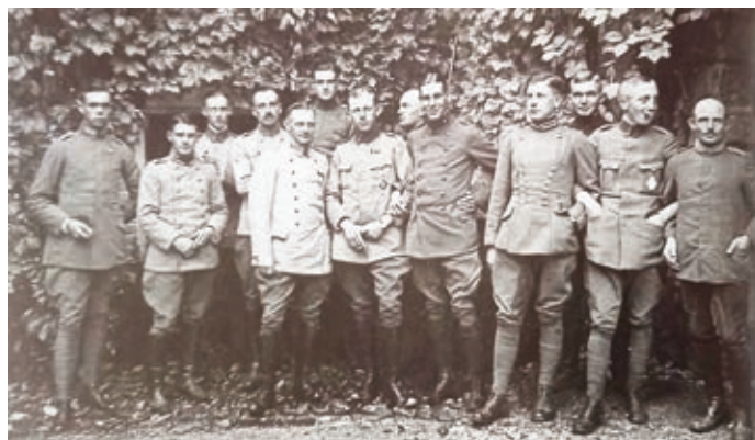
Skupinska fotografija letalcev oficirjev 14. letalskega oddelka pred Šempetrsko graščino (grad Šrotenturn) septembra 1917