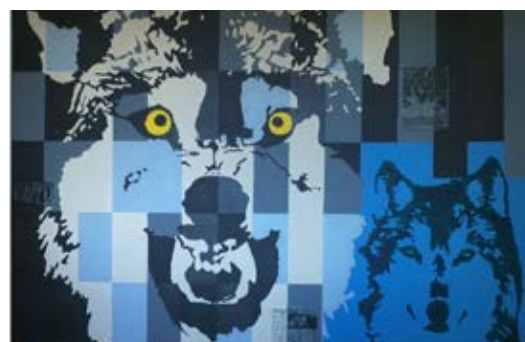
JUNAK (VOLK) / Volk je simbol junaštva, zato se večji volk brani pred sovražniki. Ne namerava se umakniti, zato mu žarijo oči.

»Slikal sem z akrilnimi barvami in nanesele tudi paus papir z besedilom o britanskem imperiju s sliko leva, ki vlada svetu. Dodal sem tudi gel.«