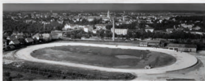
V SPOMIN NA I. MEDNARODNE SPEEDWAY DIRKE 4.5. MAJA 1957 AMD KRANJ SLOVENIJA - JUGOSLAVIJA