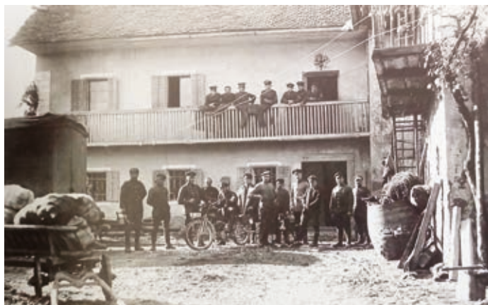
V današnji Gasilski ulici 9, po domače Pr' Tonci, so prebivali podoficirji 14. letalskega osebja. Fotografija je prav tako iz septembra 1917.

V Stražišču je moštvo 14. letalskega oddelka s svojimi letali ostalo