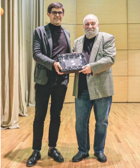
ZŠD SAVA Kranj

Zveza športnih društev SAVA Kranj se je ob 100. letnici organiziranega športa v Stražišču s svečano akademijo ter podelitvijo plaket in zahval klubom in društvom, zaslužnim športnicam, športnikom in športnim delavcem, zahvalila za njihovo dolgoletno delovanje pri razvoju športa v društvih in klubih. Mestni občini Kranj, Zavodu za šport Kranj,