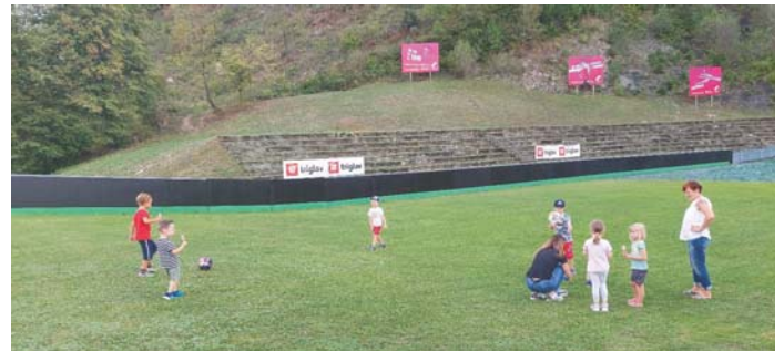
Piknik v KS Gorenja Sava, ki se odvija v začetku meseca septembra

Ob zaključku poletja ponovno vabljeni na piknik krajanov, ki ga bomo izvedli v začetku septembra, ko se velika večina že vrne z dopustov.