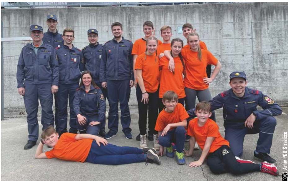
Gasilska mladina po tekmovanju v gasilskem kvizu na Trsteniku.

operativnimi člani in vajami. V preteklih mesecih smo bili pozvani na dve intervenciji, na katerih se je vse dobro izšlo. Udeležili