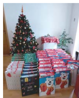
Novoletno obdarovanje starostnikov in otrok v KS Gorenja Sava

Novoletni prazniki bodo, kot vsako leto, v znamenju obdarovanj.