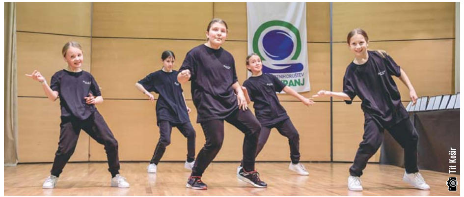
Nastop plesne skupine IMPULZ