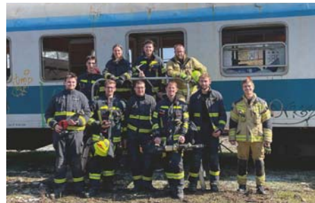
Društvena vaja na vagonu.

smo se tudi že tradicionalne vaje štirih vasi – Žabnice, Bitenj, Jošta in Stražišča. Aktivna je tudi naša mladina, ki pridno hodi na vaje in se udeležuje tekmovanj. V gasilskem domu smo prav tako zavihali rokave in preuredili našo sejno sobo.