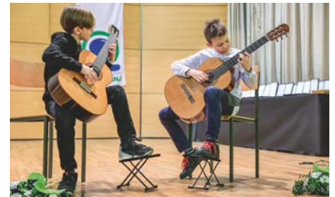
Nastop učencev OŠ Stražišče

Krajevni skupnosti Stražišče, OŠ Stražišče in gospodarskim organizacijam pa za izkazano podporo k razvoju športa in športne infrastrukture.