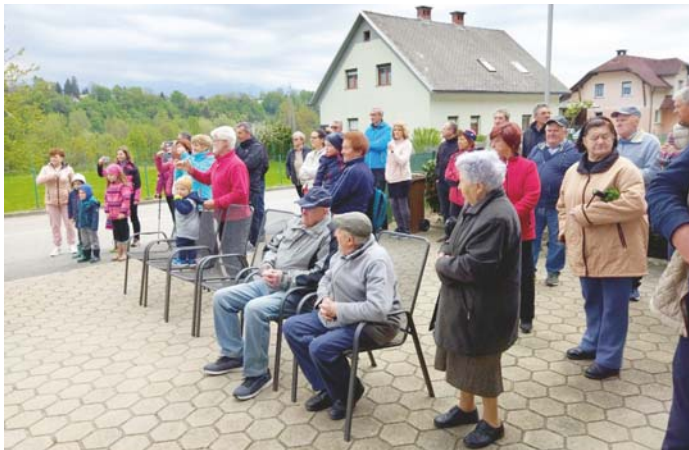
Tradicionalna jutranja prvomajska budnica s pihalnim orkestrom Kranj

Ob praznovanju 1. maja je vrsto let organizirana budnica, ki jo popestri pihalni orkester s svojim nastopom. Ob tej priliki se krajanj družimo in ob prigrizkih obujamo spomine.