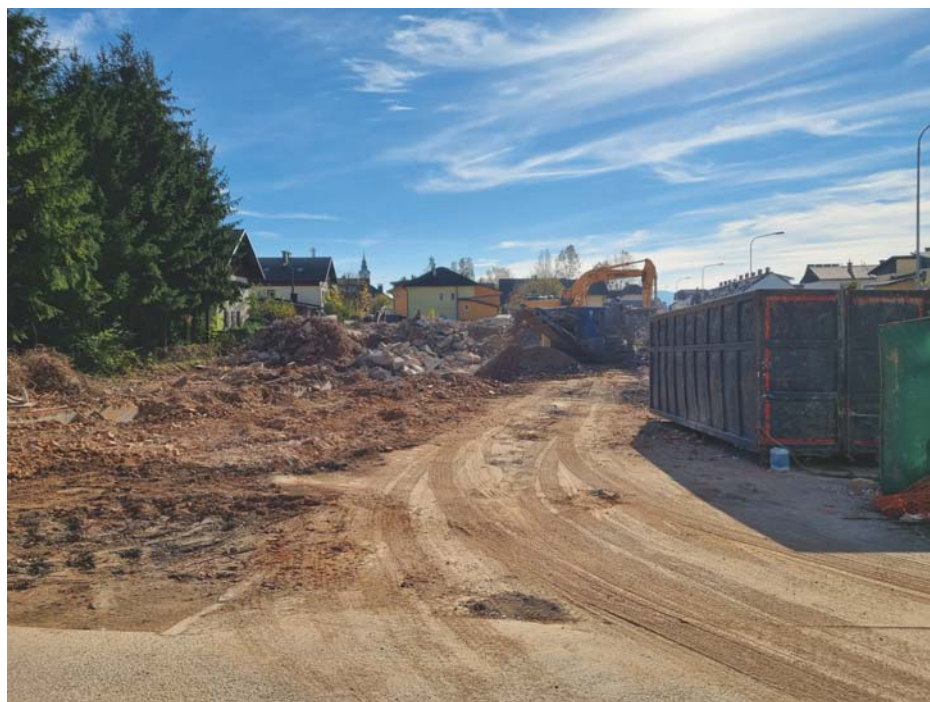
Podoba Doma Tekstilindus po enem mesecu začetka obnove