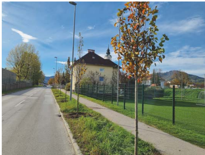
Zasaditev dreves na Škofjeloški cesti

Delovanje v tem mandatu smo začeli z željo dosega dveh glavnih ciljev, in sicer