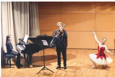
Glasbena šola Kranj