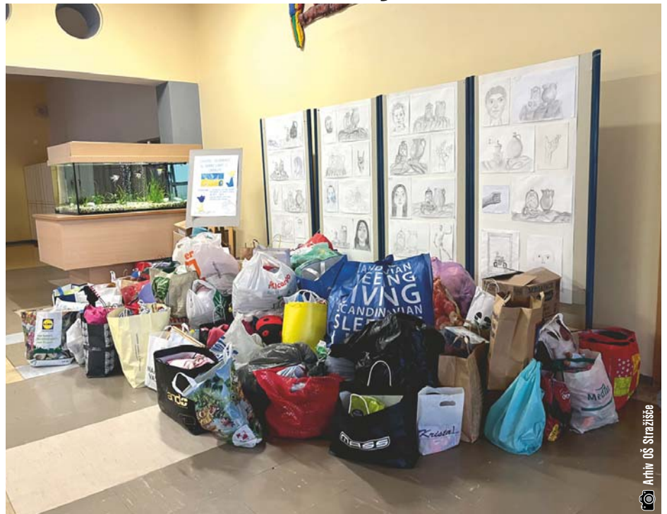
Osnovna šola Stražišče