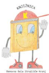
Osnovna šola Stražišče Kranj

V lanskem šolskem letu je bilo na naši šoli zaradi razmer malo obiskov šolske knjižnice, saj otroci vanjo nekaj časa niso imeli vstopa (od 19. 10. 2020 do 19. 5. 2021, kar predstavlja celo 153 šolskih dni od 194), več mesecev pa tudi ne v šolske prostore. Knjige so si učenci lahko izposodili pri potujoči knjižničarki in jih vračali v razredih. Torej je bila redna izposoja možna le prvi mesec in pol. Glede na to, da je znanstveno dokazano, da je branje besedil na tiskanem mediju neposredno povezano z učenim uspehom učenca, lahko rečem, da bi bil učni (ne)uspeh lahko drugačen, če bi bila drugačna zgoraj omenjena situacija.