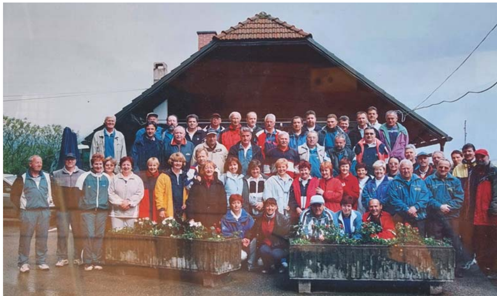
Prijateljsko srečanje med Tk Hoče in Tk Stražišče, ter med Bk Hoče in Bk Stražišče. Hoče, 8. 5. 2004.

Na podlagi javnega razpisa, objavljenega v Gorenjskem glasu, je bilo za izvajalca del izbrano podjetje Športplan, d.o.o., ki je izdelalo načrte; približno v letu dni je ob nogometnem igrišču