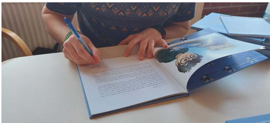
Vse fotografije razen prve so iz literarnega dogodka na Osnovni šoli Stražišče, 11. 4. 2022

Meni največji čar je, da vsako knjigo sam pripravim na novega bralca. Zavijaj roka-va, vzemi v roke telefon, na mail vtipkaj druscinaprijateljev.narocilo@gmail.com ter mi piši. Lahko pa me najdeš na Facebooku, Instagramu ali me v Stražišču pocukaš za rokav.