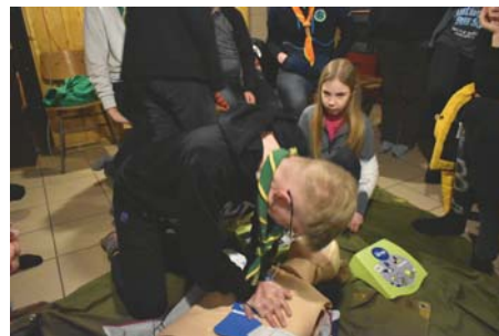
Vikend prve pomoči