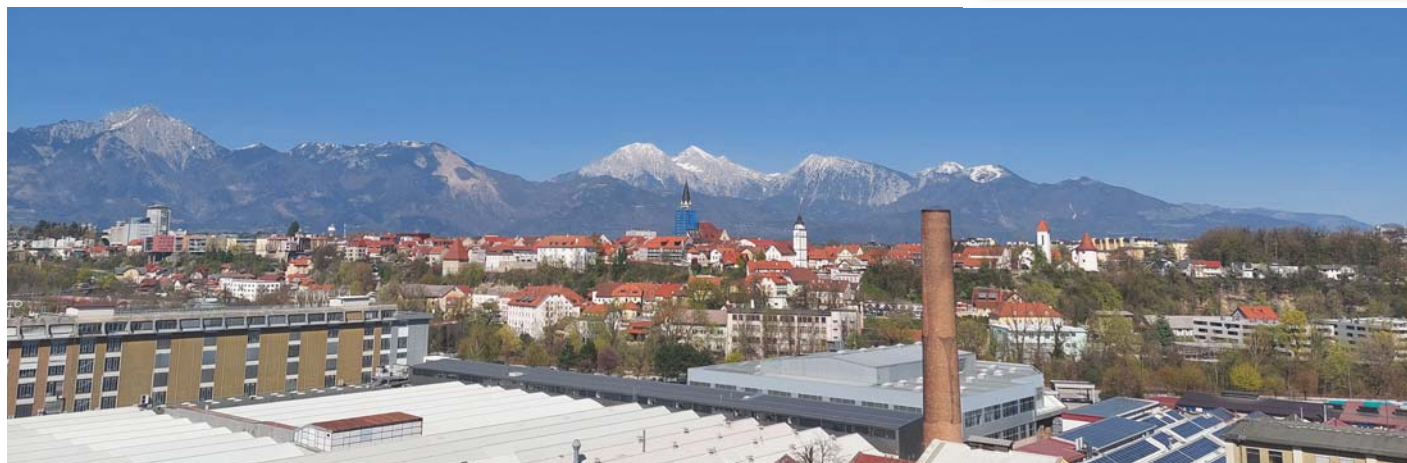
Prijeten razgled na Kranj.

Krajevno glasilo SITAR Izdajatelj in založnik: Krajevna skupnost Stražišče, Škofjeloška 18, 4000 Kranj. Za svet KS Jure Šprajc. Uradne ure KS Stražišče: torek, 16.00–18.00. Naslovnica: Pomlad v Stražišču, Špela Ankele. Lektoriranje: Nežka Kuček. Urednica: Živa Drinovec. Priprava za tisk in tisk: BOLD.