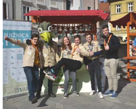
Tržnica v Kranju