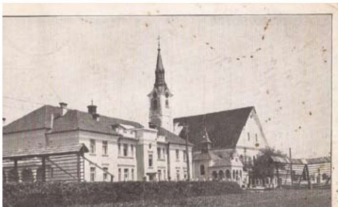
ŠMARTINSKI DOM, Šmartno pri Kranju je popisana leta 1936.

Za konec pa vas prosim, da nam ob prihajajočih praznikih namenite kakšno optimistično misel za prihodnost.