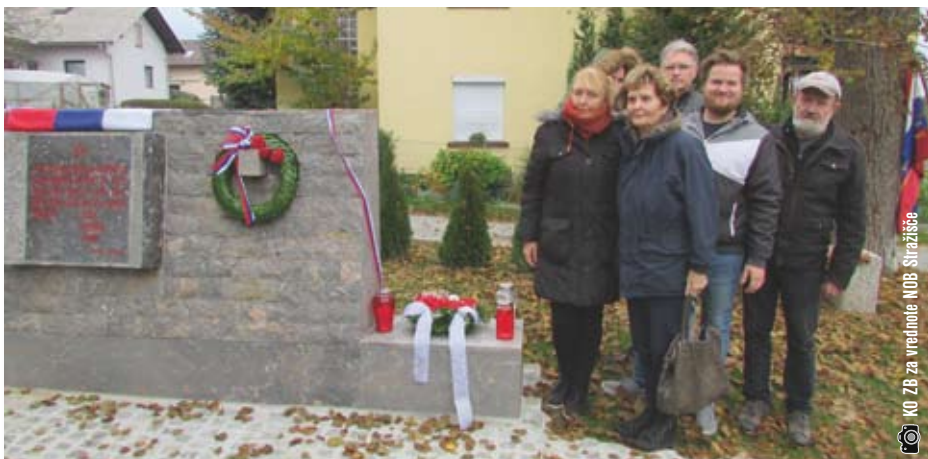
Potomci družine Šiško

da so bili med nami tudi ljudje, ki so se borili za svobodo brez orožja, a so jih okupatorske krogle vseeno pokončale, zato so ti ljudje heroji.