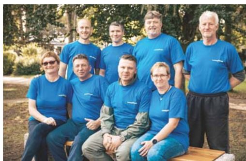
Goodyearovci po zaključku projekta postavljanja dveh klopi v Stražišču