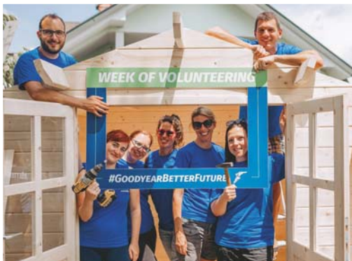
Goodyearovci po zaključku projekta v vrtcu Živ Žav v Stražišču

S številnimi projekti so tako Goodyearovi prostovoljci v lokalni skupnosti tudi lani pustili trajen pečat.