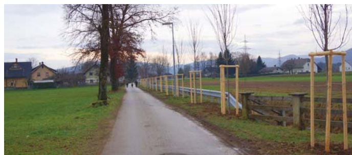
Ekološka investicija decembra 2019 v KS Stražišče - Drevored v Bantalahu z dvajset rdečimi gabri.

Nekaj podobnega se dogaja tudi s prostori, da nekdanjega Samškega doma podrobneje ne omenjamo. Folkloristom Save, ki so lani praznovali 70-letnico evropsko-svetovne prepoznavnosti in uspešnosti, med drugim so bili prvi, ki so že naslednji dan po objavljeni samostojnosti pred tremi desetletji predstavili Slovence in njihove plese (namesto načrtovanih jugoslovanskih) na gostovanju v Kanadi, ne bo treba omar z narodnimi nošami in opremo znositi na cesto pred blok. Tako rekoč nekaj sekund pred izgonom iz prostorov so izvedeli za rešitev, da s prizadevanjem KS, in ob podpori občine, lahko ostanejo v prostorih, kjer so že vsa leta. Vidno zadovoljen z rešitvijo