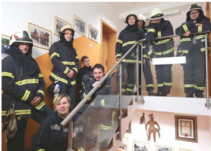
Operativna skupina gasilcev PGD Stražišče med vajami v gasilskem domu.

December je mimo in gasilski koledarji so razdeljeni. Krajanom in podjetjem se najlepše zahvaljujemo za vse prostovoljne prispevke. Zaradi velikosti našega požarnega okoliša pa se žal nismo