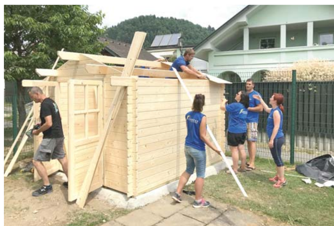
Postavljanje vrtno lope v vrtcu Živ Žav v Stražišču