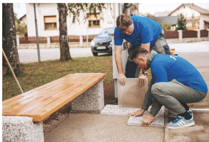
Postavljanje klopi za medgeneracijsko sodelovanje v Stražišču