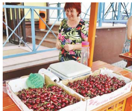
Tudi na Tržnici, kjer smo imeli tudi dan češenj, smo obeležili svetovni dan čebel, kateremu je bila še posebno pobudnica slovenska čebela Kranjska sivka.