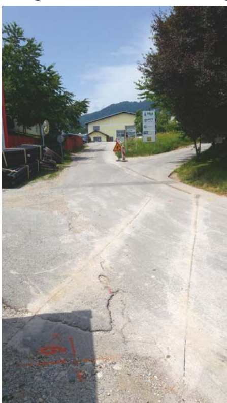
V Lazah se bo še letos (2018) začela gradnja kanalizacije.

»V zavedanju, da gre za zelo pomemben projekt, si je mestna uprava v vseh teh letih prizadevala za ureditev infrastrukture na tem območju (študije, projektiranje, izvedba ...), vendar pa projekt zaradi raznih nesoglasji pri pridobivanju potrebnih zemljišč ni mogel biti realiziran,« poudarja župan MO Kranj Boštjan Trilar in dodaja: »Danes je projekt za gradnjo kanalizacijskega omrežja v IC Laze razdeljen v dve fazi. V prvi fazi bo zgrajeno kanalizacijsko omrežje in črpališče v sami industrijski