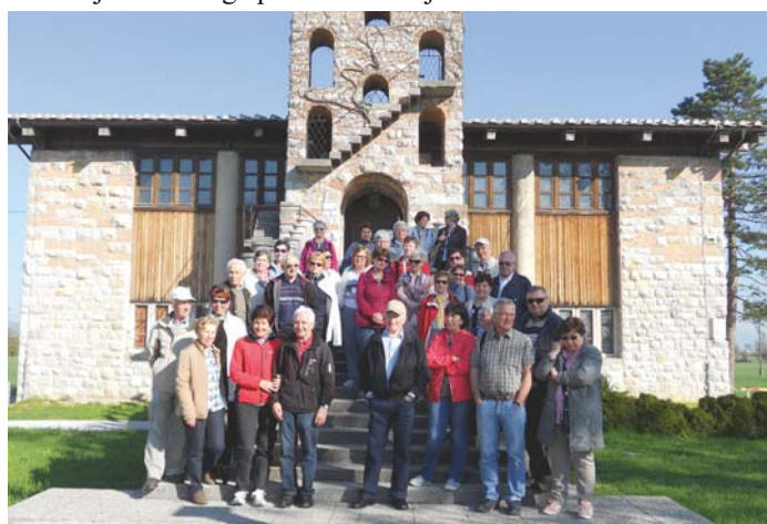
Obisk Plečnikove cerkve sv. Mihaela v Črni vasi na Ljubljanskem barju.

Obiskali smo 105 članov društva, ki so dopolnili 80 let in člane nad 85 let starosti.