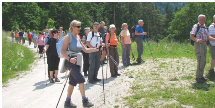
Stenica nad Blagovico

Imamo bogat in zanimiv program. Letos smo obiskali ljubljansko barje, Vrhniko, Tehniški muzej Slovenije, Dolenjsko. Imeli smo 3-dnevno letovanje v Izoli, pustovali smo v Šmartinskem domu, imeli občni zbor v Bitnjah, sodelovali smo na pikniku Pokrajinskega združenja društev upokojencev (PZDU) Gorenjske v Moravčah in si ogledali snemanje oddaje Slovenski pozdrav v Begunjah. Planinci so se povzpeli na Šentviško planoto in Črvov vrh, Bohor in Kum ter se udeležili slovesnosti ob krajevnem prazniku Bitenj na Plancici. Imeli smo pet kolesarskih izletov, vaje ženske telovadbe, bowlinga v Planetu TUŠ ter ivitalis vadbe v Šmartinskem domu. V sodelovanju z RK Kranj smo organizirali merjenje holesterola, sladkorja in krvnega pritiska v Bitnjah in Stražišču.