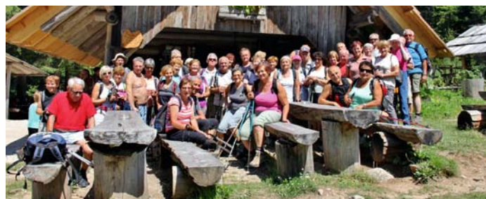
Na poti proti Martuljkovim slapovom