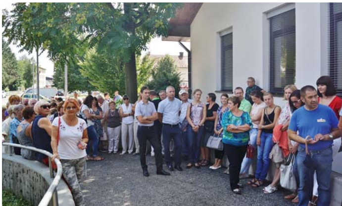
Od 11. avgusta 2017 imajo krajanjani Stražišča razširjen in prenovljen Zdravstveni dom.

Pred nekaj meseci je na Vrhniki zagorelo v podjetju Kemis in ta katastrofa nas je še dodatno motivirala, da smo v zadnjih mesecih veliko časa namenili reševanju alarmantnega stanja v Lazah. Zavedati se moramo, da v tem degradiranem območju ni le eno podjetje, ki predstavlja potencialno nevarnost za onesnaženje, temveč gre za