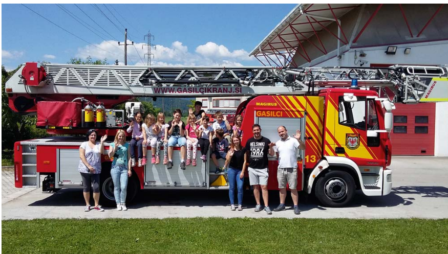
Gasilska mladina na obisku pri poklicnih gasilcih.

Na področju operative bodo tudi v tem letu interna usposabljanja in usposabljanja v sodelovanju z drugimi društvi in poklicnimi gasilci. Člani pa se bodo udeleževali tudi raznih strokovnih izobraževanj, kjer bodo pridobili nove specialnosti ali višje čine. Za varnost Stražišča bo tako dobro poskrbljeno.