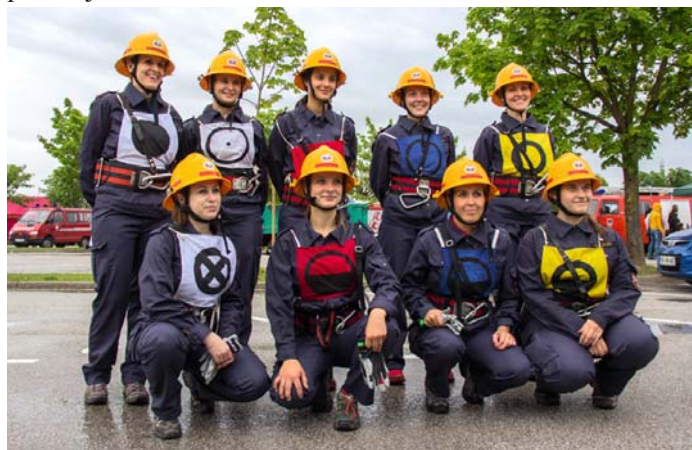
V društvu so vse bolj dejavna tudi dekleta.

V prihodnjih dneh jih čaka sodelovanje pri evropskem projektu Postanimo odporni na nesreče , v sklopu katerega bodo 13. septembra v dopoldanskih urah izvedli vajo evakuacije Osnovne šole Stražišče.