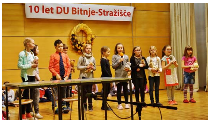
Kulturni program so pripravili učenci drugih in tretjih razredov Osnovne šole Stražišče.