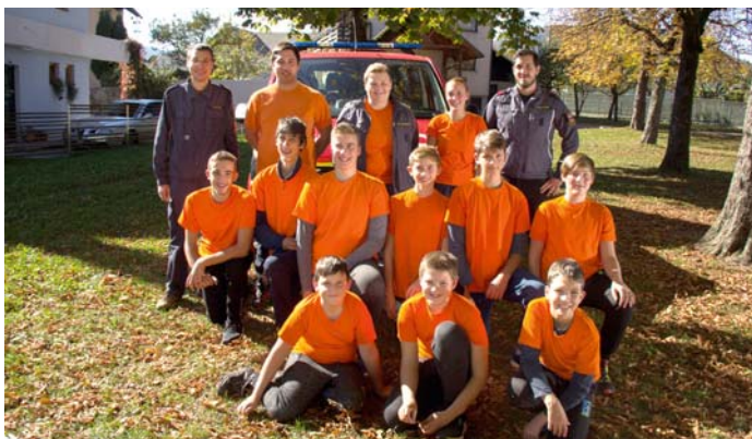
Nasmehana desetina mladincev po zaključnem regijskem tekmovanju.

Gasilci nikoli ne počivamo. Z začetkom šolskega leta smo ponovno začeli z gasilskimi vajami za najmlajše. Le-te potekajo ob petkih popoldan, člani društva pa smo zelo ponosni, saj se je število otrok v primerjavi z lanskim letom močno povečalo. Prva gasilska tekmovanja jih sicer čakajo šele v naslednjem koledarskem letu, v začetku oktobra pa se je desetina mladincev udeležila regijskega tekmovanja v Senčurju, kjer so med štiriindvajsetimi ekipami zasedli več kot odlično osmo mesto. To je bil velik uspeh za celotno društvo, saj je minilo že veliko časa, od kar se je kakšna naša ekipa uvrstila iz občinskega na regijsko tekmovanje.