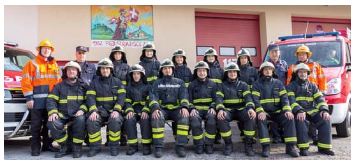
Novo člane z veseljem sprejmemo v naše vrste.