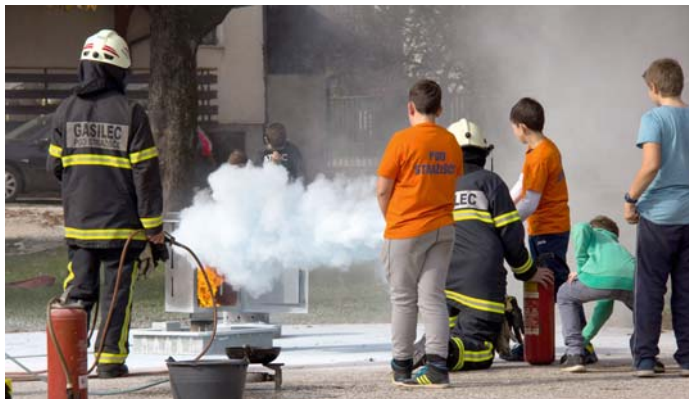
Na dnevu odprtih vrat smo obiskovalcem pokazali, kako gasiti z ročnimi gasilnimi aparati.

Pridni smo bili tudi operativni člani. V mesecu septembru smo imeli dve vaji, nočno in komisijsko, ki potekata tako, kot bi šlo za pravo intervencijo. V sklopu evropskega projekta Postanimo odporni na nesreče smo se udeležili dveh vaj skupaj z drugimi