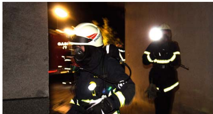
Utrinek z nočne vaje.

društvi in poklicnimi gasilci. Aktivni smo bili tudi na področju usposabljanj in se udeleževali raznih izobraževanj. 21. oktobra smo uspešno izvedli Dan odprtih vrat, saj je bilo obiskovalcev več, kot smo pričakovali. Novembra smo gostili najmlajše goste iz Baragovega vrtca, v preteklih tednih pa smo sodelovali tudi na dveh intervencijah. Aktivno nam pomagajo tudi veterani in članice, v prihodnjem letu pa se nam obeta tudi desetina veterank, kar bo tudi novost za naše društvo.